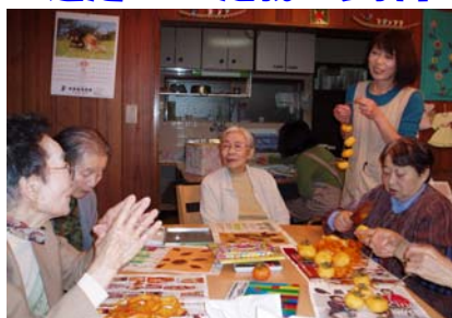
「干し柿作りをしました！」

皆さんにおいてもらった柿は、冬の冷たい風にあたり美味しい「干し柿」になり、遠足では「定義山参拝」に出掛け、紅葉狩りと美味しい油揚げを食べてきました。