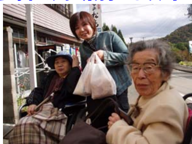
「お土産、いっぱいです。」