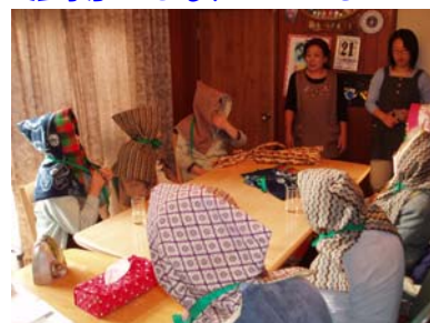
「何をしていますのしょーか？」