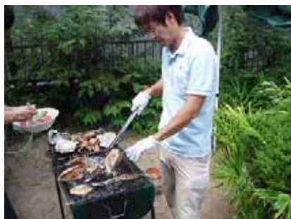
どんどん焼いています!

敬老会として、日だまりの庭でバーベキューを行いました。さんまやホタテ、春に植えたじゃがいも等を焼き、おにぎりや豚汁を皆様と一緒に作って食べると「こんなの何年ぶりかしら!？」「外で食べると格別だね!」と口々に話され、大変好評でした。6月にはあやめまつりにも出掛けています。日だまりはいつも天気にも恵まれます!