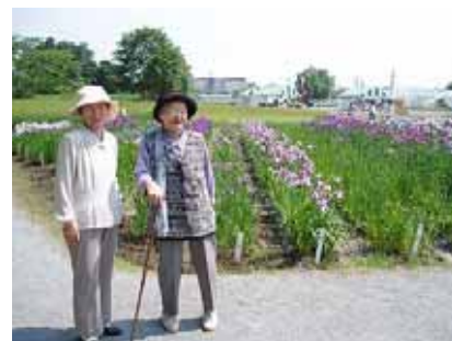
素晴らしい景色です!