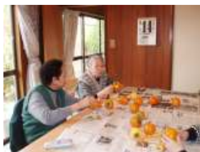
「美味しく出来るかな？」