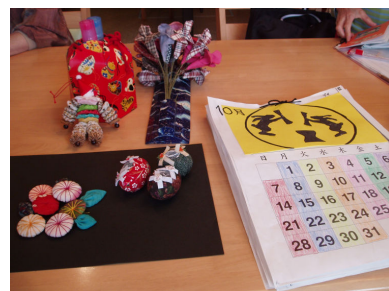
「皆さんの作品です」