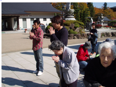
「健康でありますように」

趣味活動では、裁縫・切り絵等皆さんそれぞれが、興味のある物に取り組んでいます。下記の写真は“皆さんの作品”の一部です。とても素晴らしい作品が出来上がりました。